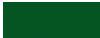
Moosgrün Ral 6005 (Preisgruppe 2)