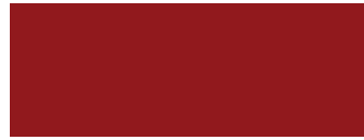
Rubinrot Ral 3003 (Preisgruppe 2)