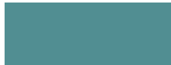
Pastellblau Ral 5024 (Preisgruppe 2)