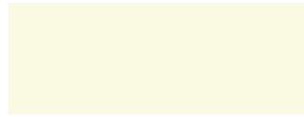
Perlweiss Ral 1013 (Preisgruppe 2)

Nachstehend sind einige Beispiele auf die Farben dargestellt, die wir Ihnen anbieten können.