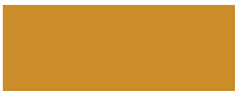
Lasur Hell Eiche L1 (Preisgruppe 3)