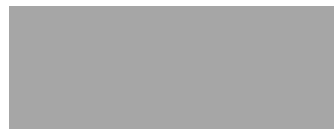
Fenstergrau Ral 7040 (Preisgruppe 2)