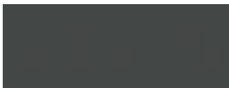
Anthrazitgrau Ral 7016 (Preisgruppe 2)